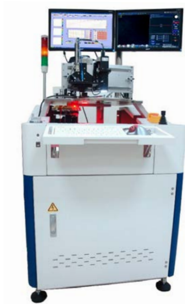
图01 Shining Technologies的多点LED测试系统

现在,Shining Technologies采用NI SMU,其采样率为1.8 MS/s,这一特性在业界首屈一指。SMU能够同时测量在同一通道中传播的高精度电压和电流。这不仅降低了硬件采购成本,而且简化了测试系统的复杂性,避免了必须使用低采样分辨率示波器等问题。